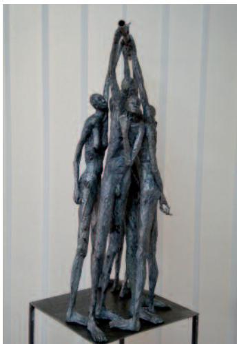
Figuren von Betty Hanns

Gross, blond und blaue Augen, ein nordischer Typ könnte man sagen, so repräsentiert sich der Newcomer AHA. Nicht verwunderlich, dass er eine Sehnsucht nach dem rauen Klima, der unendlichen Weite und dem klaren hellen Licht des Nordens hat. Seine Menschen sind sichtbar und unsichtbar. Eigenständig, unabhängig, freidenkend, freigeistig, wie er selbst. ■