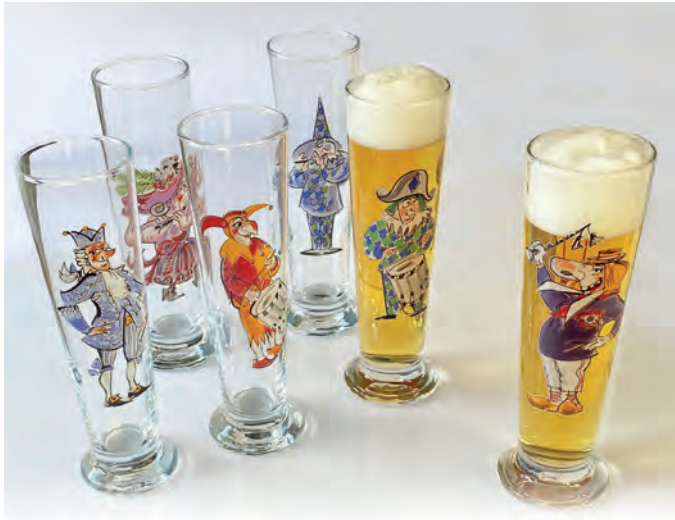
z.B.: Sägg's Bebbi-Biergleeser mit Fasnachtsfigure