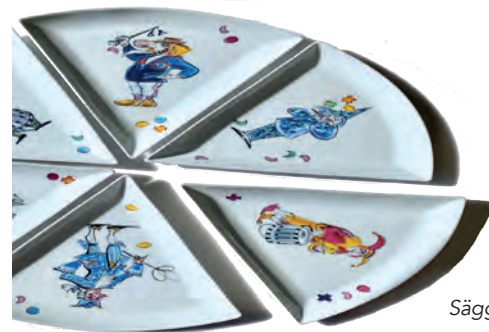
z.B.: Sägg's Säggstelkraisdäller für Basler Ziibelevaie