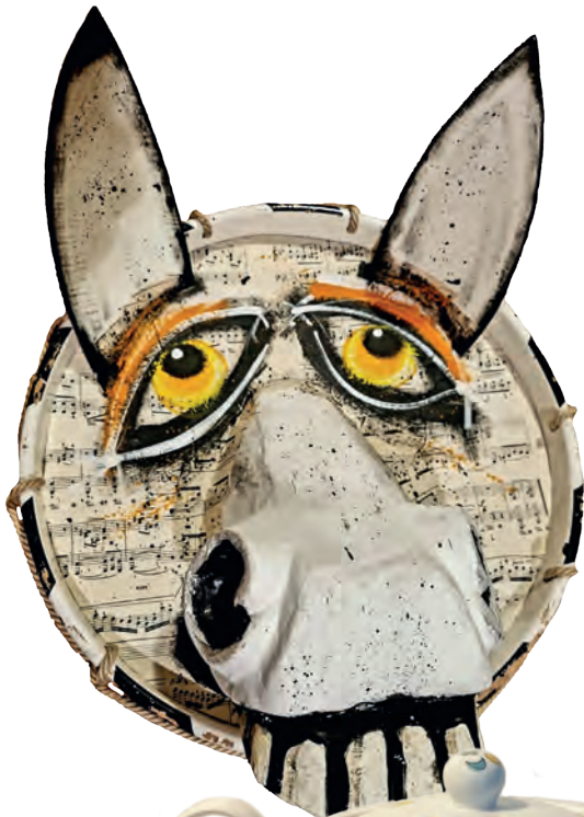
Larve im Reif Benny Zeuggin