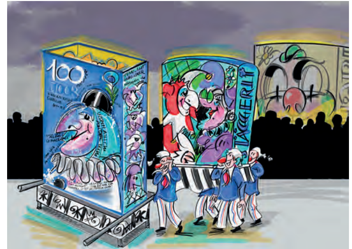
Drucke, gerahmt, in kleinsten Auflagen