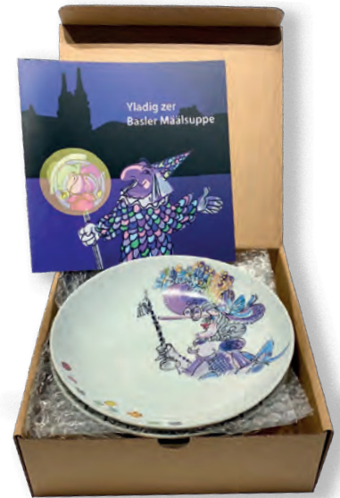
z.B.: E Pagg mit 4 Suppedäller und eme Rezäpt für Basler Määlsuppe