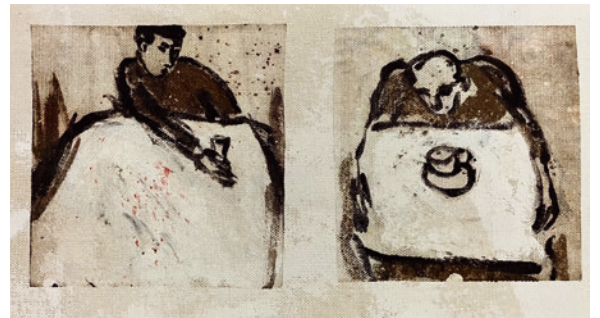
«Das lange Warten», 2019, Oel auf Leinwand, 65 x 84 cm