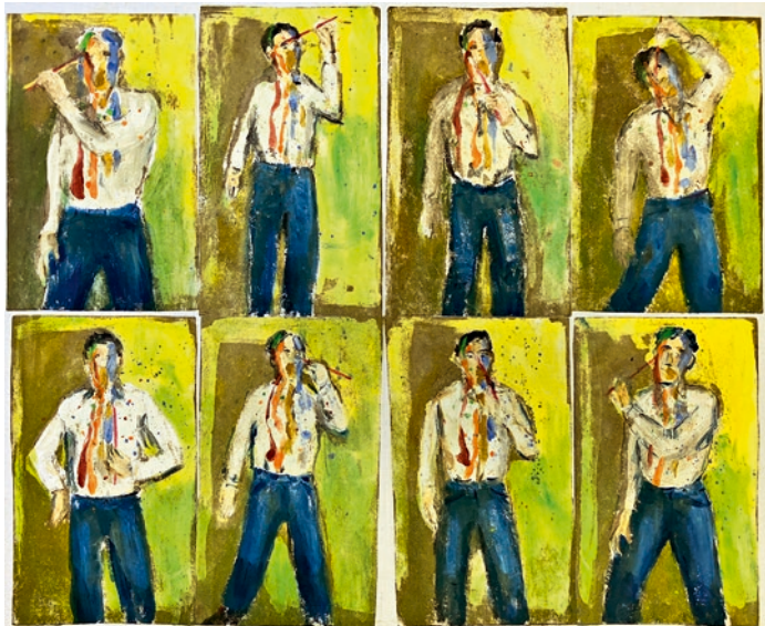
«Die Bemalung», 2020, Oel auf Leinwand, 50 x 60 cm