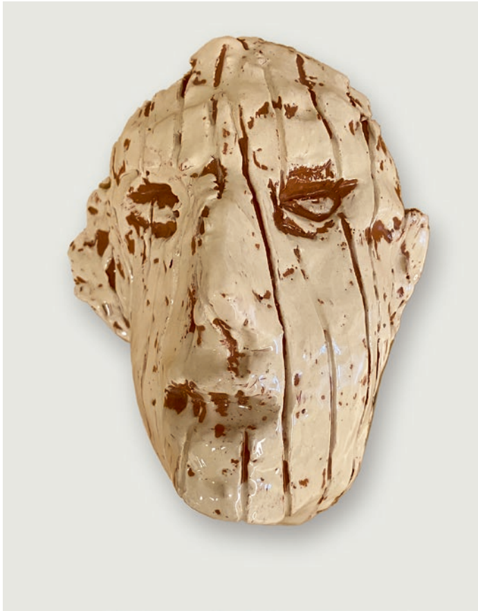
«O.T.», ca. 2015, Keramik (ohne Sockel), 14,3 x 12 cm