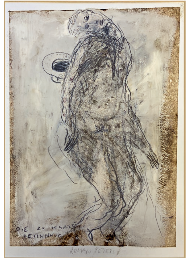
«O.T.», 2019, Oel und Bleistift auf Papier, 30 x 21 cm