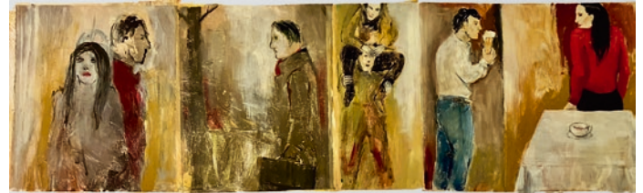
«Die Feier» 1+2, 2022, Oel auf Papier, je 24 x 46,5 cm