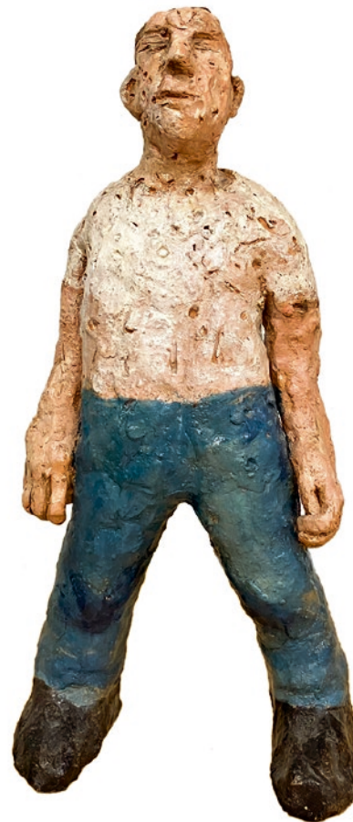
«Türsteher», 2023, Oel auf Keramik, Höhe: 33 cm

Gestaltung: Enrico Luisoni · www.arttape.ch © 2023, alle Bilder: Roman Peter, Basel Printed in Switzerland