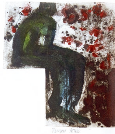
«O.T.», 2020, alle Oel auf Papier, o.l.: 24,5 x 15 cm / o.r.: 25 x 16 cm / unten: 23 x 20,5 cm