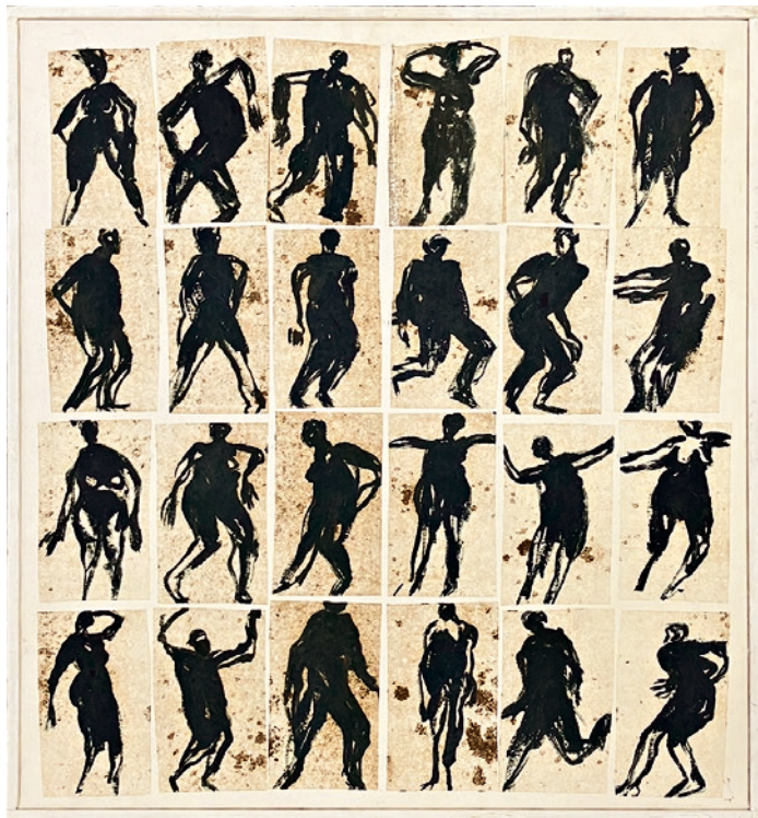
«Tanz», ca. 2011, Oel auf Leinwand, 67 x 60 cm