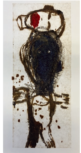
«Die Träume der Artisten», 1+2, 2021, Öl auf Papier, 1: 20 x 12 cm / 2: 23 x 10 cm