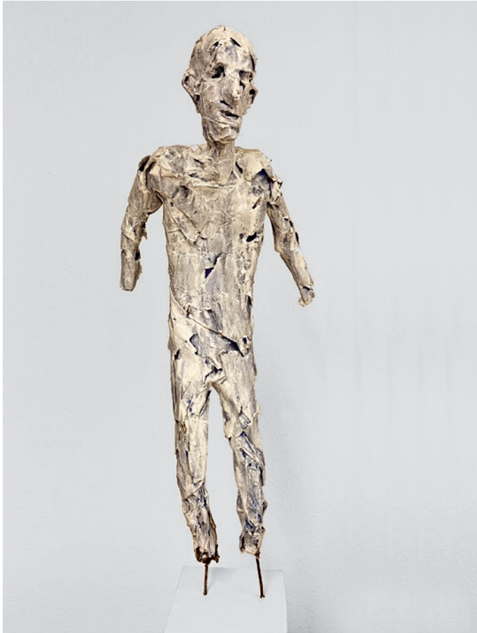
«O.T.», 2009, Zellulose, Höhe: 64,5 cm (mit Sockel 104 cm)