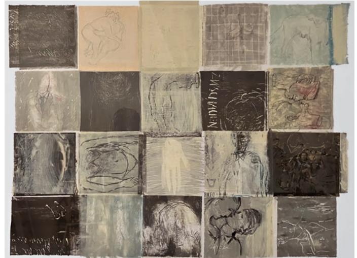
«Die Bilder vor dem Schlaf», ca. 2010, Oel auf Papier, 85 x 62 cm 23