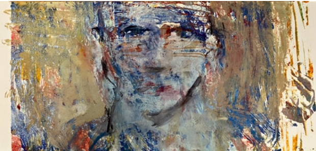
Oben: «O.T.», 2018, Oel auf Papier, 17 x 9,5 cm Unten: «O.T.», 2020, Oel auf Papier, 13,5 x 24,5 cm