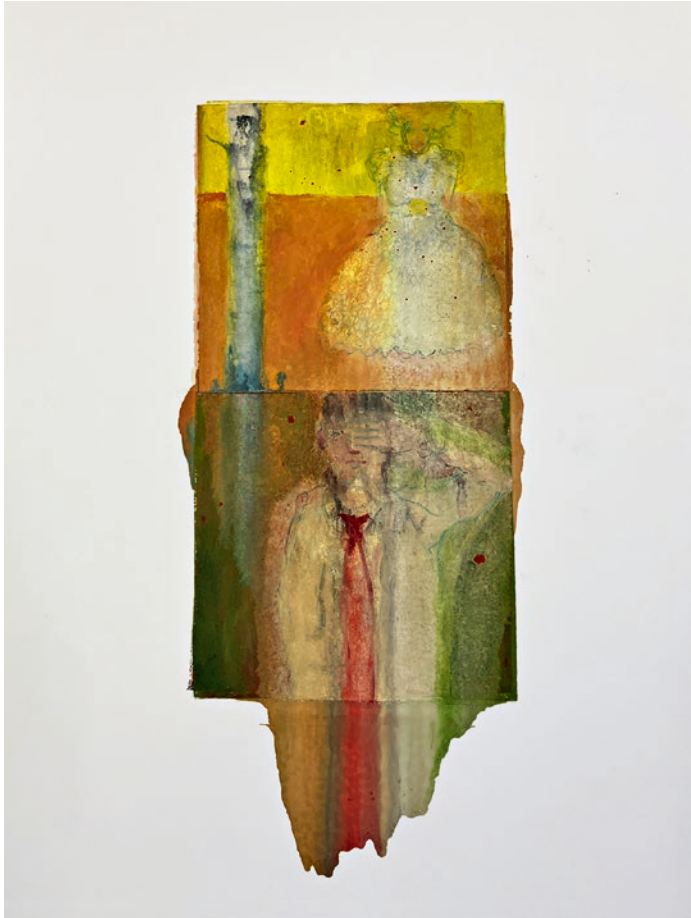
«Gestern, vor langer Zeit», 2022, Oel auf Papier, 52 x 22 cm