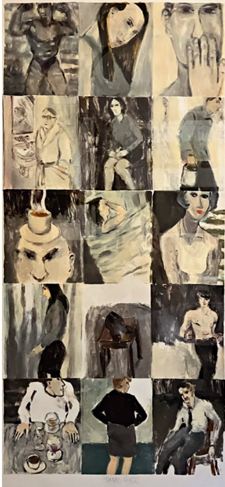
«Zuviel für einen Tag», ca. 2010, Oel auf Papier, 97 x 45 cm 22