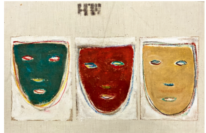
Oben: «O.T.», ca. 2019, Oel auf Papier, 15,5 x 22 cm Unten: «O.T.», 2020, Oel auf Leinwand, 14,5 x 32 cm