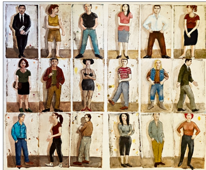
«Die Firma», 2016, Oel auf Leinwand, 70 x 80 cm