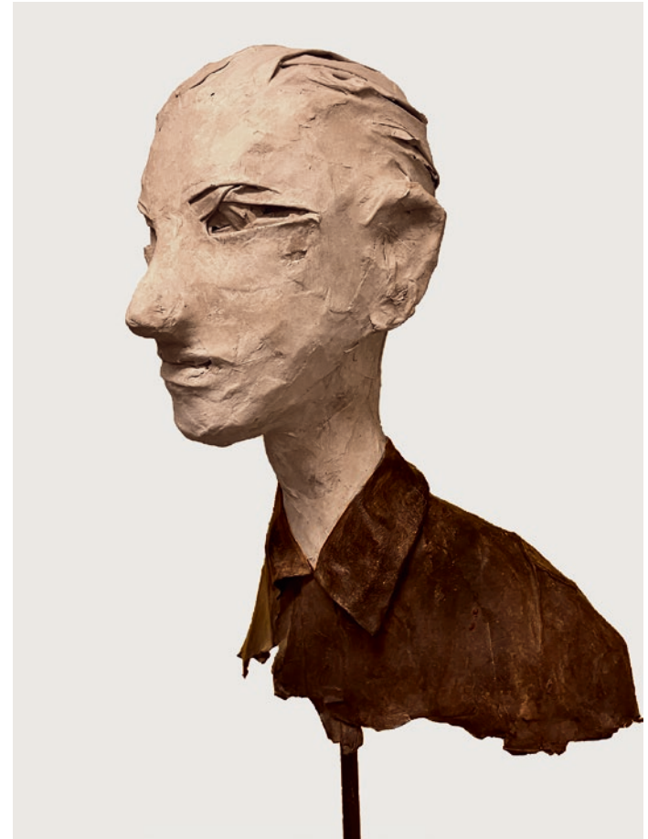
«O.T.», 2015, Zellulose, Metall, 172 x 36 cm