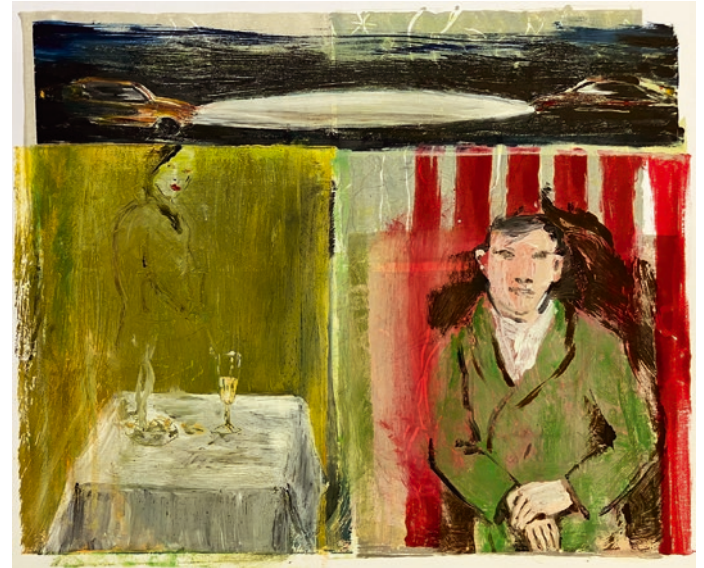
«O.T.», 2022, Oel auf Papier, 27 x 33 cm